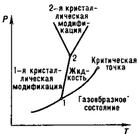
Тройные точки (1 и 2) на диаграмме состояния в координатах P-T (давление — температура).

аллотропные разновидности кристаллической) могут совместно сосуществовать только при значениях темп-ры T , и давления P , определяющих на диаграмме P-T координаты Т. т. (рис.). Для CO_2 , напр., T_t = 216,6 К, P_t = 5,16 \cdot 10^5 Н/м 2 , для Т. т. воды — основной реперной точки абс. термодинамич. температурной шкалы — T_t = 273,16 К, P_t = 4,58 мм рт. ст. (609 Н/м 2 ).